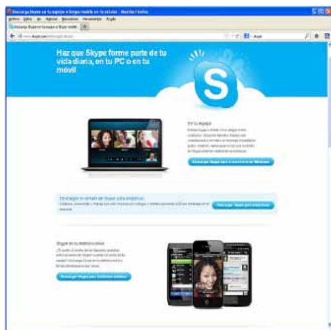
Imagen 2 - Skype

Es una aplicación que nos permite comunicarnos con otros usuarios de manera gratuita y con excelente calidad. Puede instalarse en dispositivos móviles Android, iPhone y Symbian , pero también en el Pc de sobremesa o portátil. Al igual que WhatsApp, requiere que nuestros interlocutores también tengan instalada la aplicación, para poder chatear y hablar entre ellos. También permite hacer llamadas a teléfonos fijos y móviles a tarifas más económicas que las compañías telefónicas tradicionales.