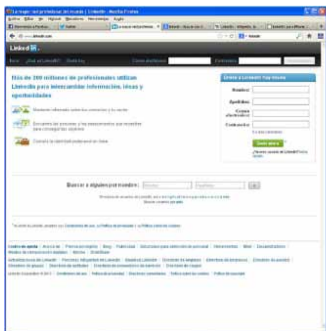
Imagen 7.- LinkedIn.

LinkedIn es una red social, pero en este caso, exclusiva para profesionales y orientada a negocios, con más de 200 millones de usuarios registrados en más de 200 países.