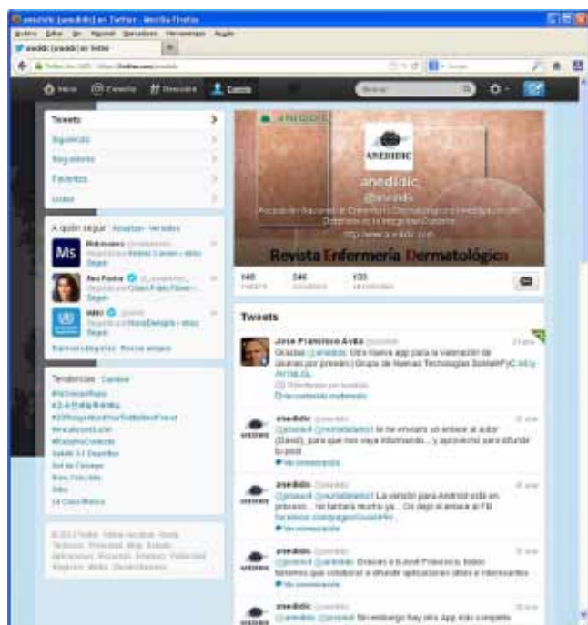
Imagen 6.- Twitter ANEDIDIC.

ANEDIDIC os invita a “seguirnos” en nuestro Twitter corporativo: @anedidic ( https://twitter.com/anedidic ) (Imagen 6).