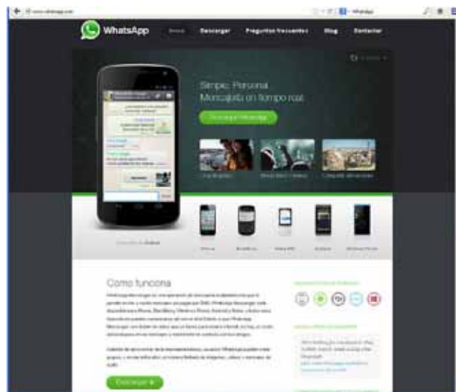
Imagen 1 - WhatsApp.

En este número haremos un pequeño recorrido por alguna de las más exitosas (que crecen sistemáticamente en número de usuarios) en el ámbito de la comunicación: WhatsApp, Skype, LinkedIn, Facebook y Twitter, que si bien no tienen relación específica con el ámbito sanitario, si que están sirviendo de vía para favorecer, canalizar y facilitar la interrelación de multitud de profesionales (a pesar de enormes distancias geográficas), difusión de noticias y eventos, intercambio y difusión de contenidos científicos, interrelación de profesionales, creación de redes de conocimiento, etc.