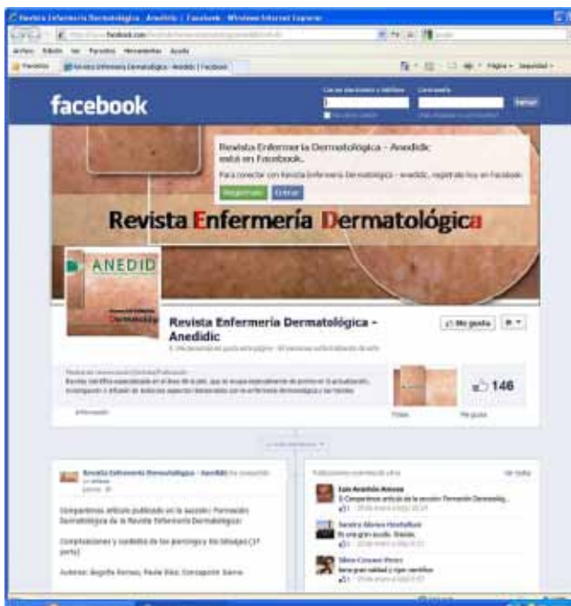
Imagen 4.- Revista Enfermería Dermatológica en Facebook.

http://www.facebook.com/RevistaEnfermeriaDermatologicaAnedidic?ref=hl (Imagen 4).