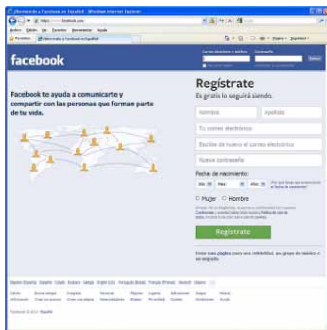
Imagen 3.- Facebook.