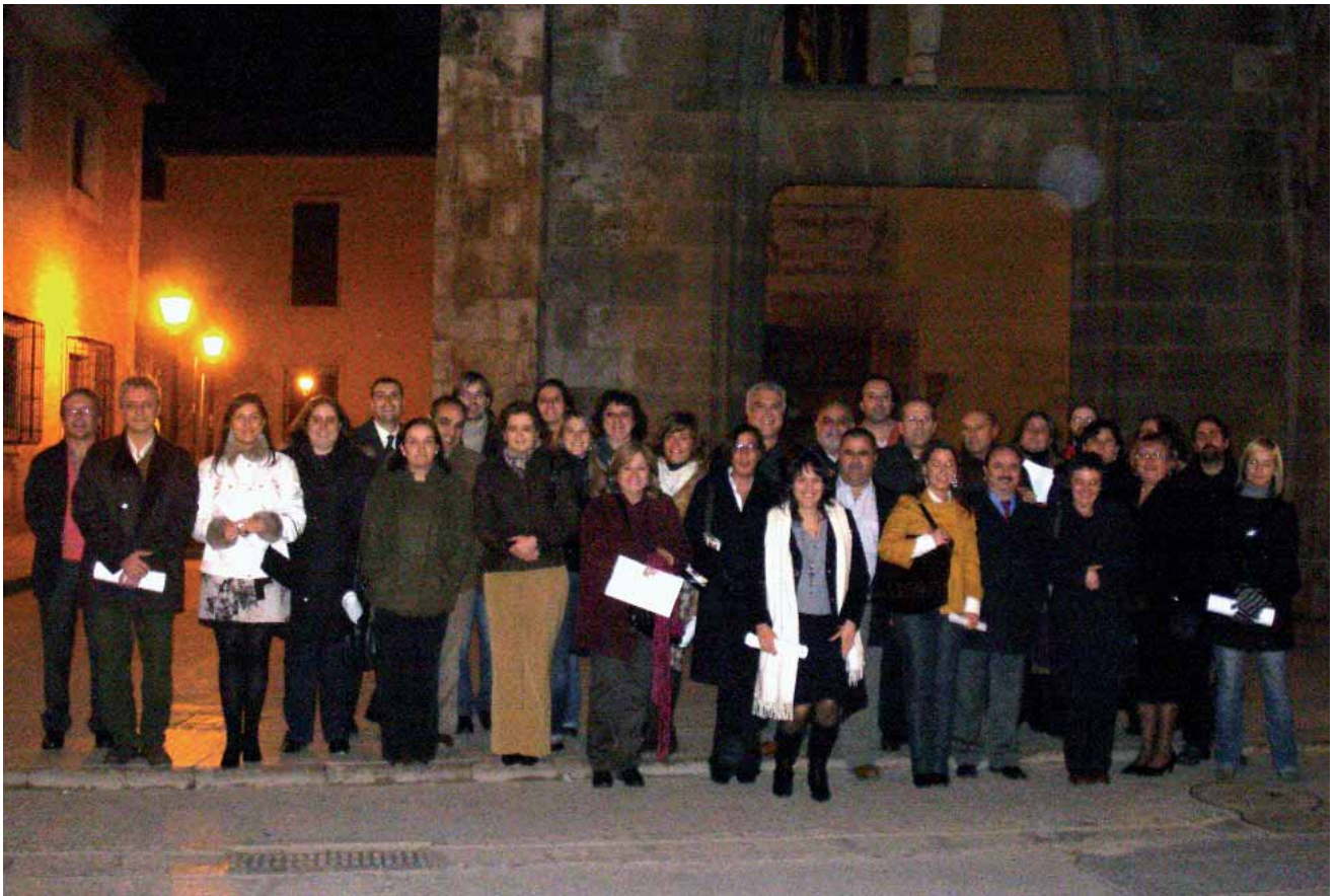
Grupo 1ª promoción.