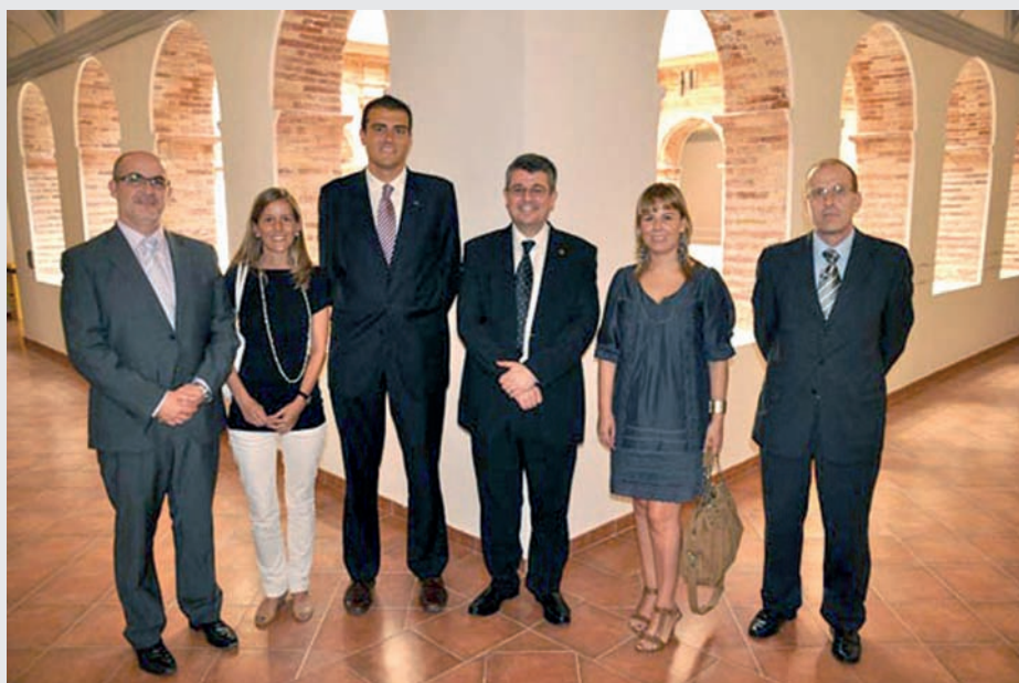
Firmantes del Convenio